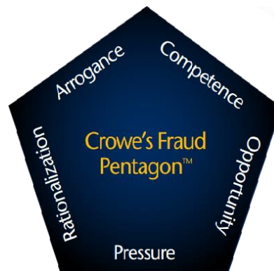
Gambar 1. Unsur-unsur dalam Fraud Pentagon Theory

Fraud Pentagon Theory merupakan perluasan dari teori Fraud Triangle dengan menambahkan dua unsur yang dapat digunakan untuk mendeteksi kecurangan yaitu kompetensi dan arogansi. Kompetensi ( competence ) adalah kemampuan karyawan untuk mengabaikan pengendalian internal, mengembangkan strategi penyembunyian, dan mengendalikan situasi sosial untuk memperoleh keuntungan bagi dirinya. Arogansi ( arrogance ) atau kurangnya hati nurani adalah sikap dan sifat superioritas atau keserakahan, dimana seseorang merasa berhak dan percaya bahwa pengendalian internal tidak berlaku untuk dirinya (Crowe, 2012). Arogansi dan kemampuan disebut sebagai poin penting dalam tindakan penipuan karena pelaku dapat melakukan tindakannya secara berulang dengan sifat arogansi dan kemampuan yang dimilikinya (Wiwit et al., 2018).