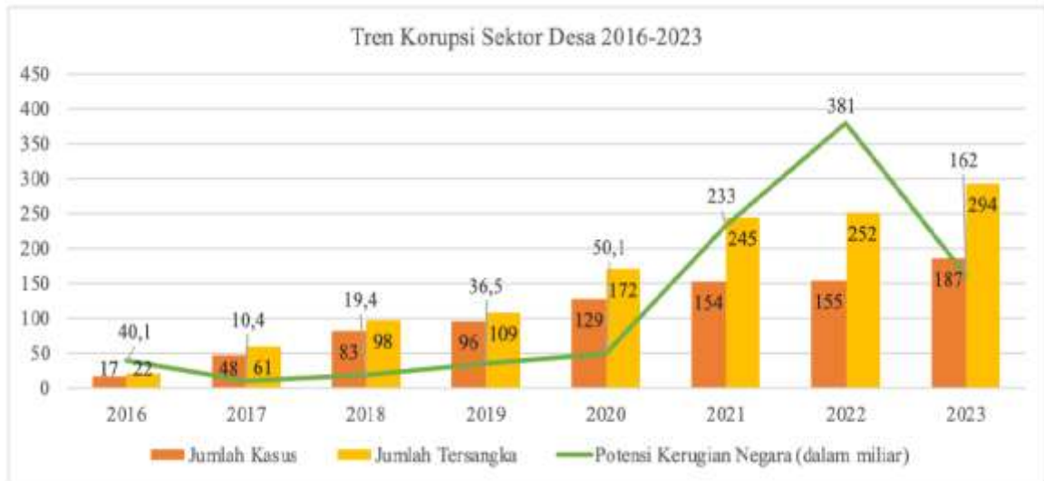
Gambar 1. Tren Korupsi Sektor Desa 2016-2023

Gambar 1 menunjukkan Tren Korupsi Sektor Desa 2016-2023 menurut Laporan Hasil Pemantauan Tren Korupsi Tahun 2023